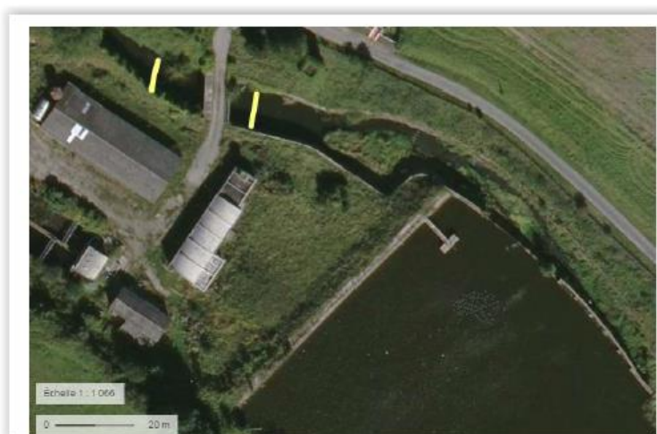
Localisation des filtres anti-MES

-des filtres anti-MES (Matières En Suspension) seront mis en place en deux endroits à l'aval du barrage afin de retenir les particules rejetées durant les travaux et notamment la vidange.